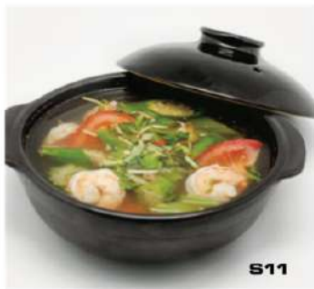
S11 越式酸虾汤 12,90€ Cang chua tom Marmite de soupe aux crevettes sucré et acide (tomate, celeri, gambos, ananas) Sweet and sour soup and shrimp vegetables