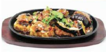
C6 铁板三宝 14,90€ Trois trésors farcis aux crevettes sur plaque chauffante