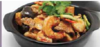
C10 八珍豆腐煲 12,90€ Pâtes de soja marinée aux fruits de mer et viandes