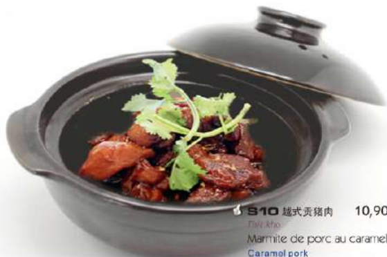
S10 越式贡猪肉 10,90€ Tôc Kho Marmite de porc au caramel (10mn) (Sale et sucre) Caramel pork