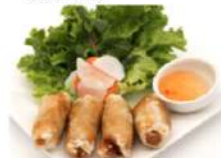
S7 越南春卷 5,90€ Cha gio Nems au porc S7P 鸡春卷 Nems au poulet