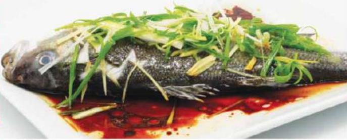
C1 清蒸巴尔鱼 19,90€ Bar à la vapeur (20min)