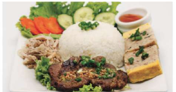
R8 越式三宝饭 11,90€ Com Tam Bi Riz aux trois trésors (10min)

Prix nets - Service compris - Photos non contractuelles: végétarien piment présence de cacahuètes présence d'œuf