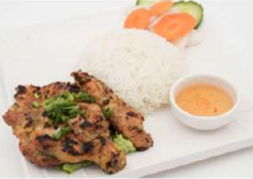
R2 香茅烤鸡腿饭 9,50€ Com ga nuong xa Riz au poulet à la citronnelle Lemongrass grilled chicken legs with rice