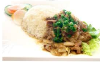
R5 洋葱牛肉饭 10,90€ Riz au bœuf sauté aux oignons Wok fried onion beef with rice

Prix nets - Service compris - Photos non contractuelles: végétarien piment présence de cacahuètes présence d'œuf