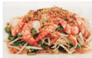
S1 木瓜虾沙律 8,50€ Goi du du tom Papaye râpée aux crevettes Shrimp papaya salad