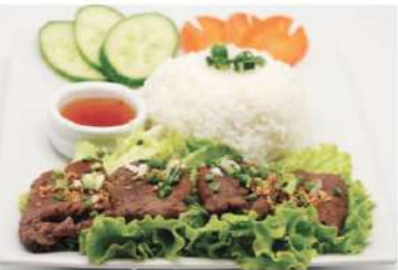
R4 香茅烤牛肉饭 9,50€ Com bò lui nuong xa Riz au bœuf grillé à la citronnelle Lemongrass grilled beef with rice