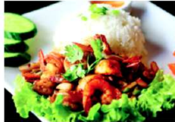
R6 香炒虾仁米饭 11,90€ Com tom rim Riz aux crevettes sautées aux oignons Wok fried onion shrimps with rice