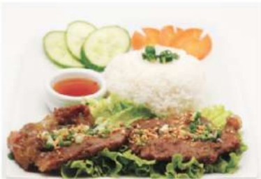
R3 香茅烤猪排饭 9,50€ Com thit nuong xa Riz aux côtes de porc à la citronnelle + 1 côte de porc 4,50€ Sans riz 9,00€ Lemongrass grilled pork with rice

Prix nets - Service compris - Photos non contractuelles: végétarien piment présence de cacahuètes présence d'œuf