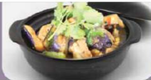
C8 鱼香茄子煲 10,90€ Aubergine porc haché Eggplant with minced pork

Prix nets - Service compris - Photos non contractuelles végétarien piment présence de cacahuètes présence d'œuf