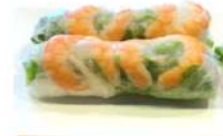
S9 鲜虾生春卷 6,30€ Goi cuon tom Rouleaux de printemps aux crevettes et poitrine porc (servis froids) Shrimp spring rolls