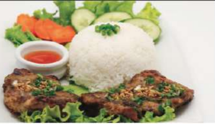
R1 香茅烤排骨饭 10,50€ Com suon nuong xa Riz aux travers de porc à la citronnelle Lemongrass grilled ribs with rice Sans riz 9,90€