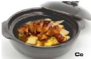
Cc 酸梅鸭腿煲 10,90€ Cuisse de canard à la sauce aux prunes en marmite Duck leg in plum sauce