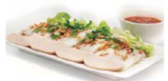
S6 越南蒸粉 7,50€ Banh cuon Raviolis vietnamiens à la vapeur (porc, pâté de porc) Steamed vietnamese ravioli