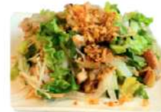
S4 香茅鸡沙律 8,50€ Goi ga nuong xa Salade de poulet à la citronnelle vietnamienne