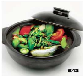
S13 越式生鱼酸汤 11,90€ Cang chua ca bong lao Marmite de poisson (pangas) sucré et acide (tomate, celeri, gambos, ananas) Sweet and sour soup with fish and vegetables