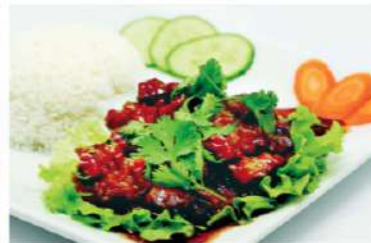
R7 越式贡猪肉 11,90€ Com thit kho Riz au porc caramélisé (salé et sucré) (10min) Caramel pork rice