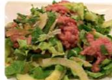
S5p 泰式牛肉沙律 8,90€ Salade de bœuf cru façon thaïlandaise