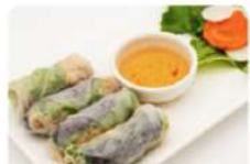
S8 越南猪肉丝卷 6,90€ Bi cuon Rouleaux au porc laminé (servis froids) Pork spring rolls